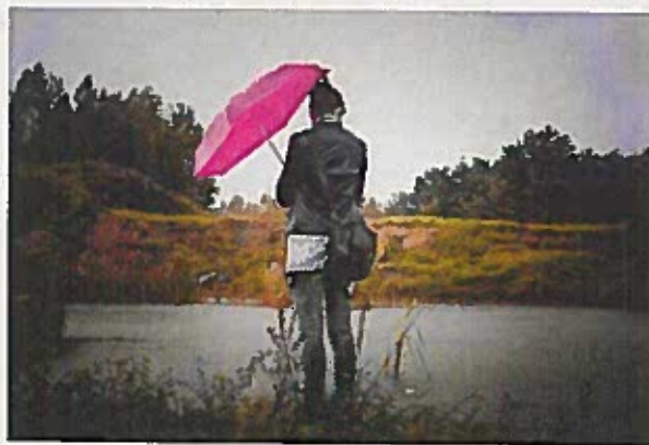
Karjers kas izveidojies pēc cilvēku pārapbēdīšanas

klusuma stundās muedzins ar megafonu aicināja uz lūgšanu. Vecpilsētā daudz kas atgādināja austrumu bazāra sajūtu un, ja garām pagāja vīrietis dzinšās ar sievieti, kas bija pilnīgi, vai daļēji aizplīvurota, tad katram kļuva skaidrs, ka tu neesi vairs savā kultūras vidē. Autobusa braucienā uz ziemeļiem šī sajūta pastiprinājas kad starp kalniem ciematos varēja manīt, ka tur pilsoņu kara bēgļi apbūvējuši vai katru brīvo vietīņu, bet vēl vairāk piesaistīja uzmanību ik pa dažiem kilometriem jaunuzceltie musulmaņu dievnami, kuru baltie minareti viens ar otru tā kā sasaucās. Viss tas tapis pateicoties dāsniem arābu ziedojumiem. Tomēr kad tika šķērsota iekšējā robeža, iebraucot Serbskas republikā, aina strauji mainījās: bija uzkrītoši daudz pamestu ēku un mošeju vietā stājās grezni pareizticīgo dievnami. Iebraucot serbu dominētajā Prijedoras pilsētā aina un cilvēku uzvedība līdzinājās Latvijā pieredzētajam 90-to gadu sākumā.